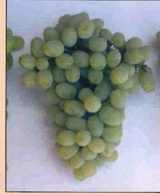
योग्य जाडीचे देठ