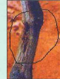
पोखरलेल्या भागातून डिकासाखा चिकट पदार्थ येतो

त्याप्रमाणे ज्या छिद्रामध्ये खोडकिडा आहे त्यातून मोठ्या प्रमाणात भूसा पडलेला दिसतो. ज्या झाडामध्ये खोडकिडा आहे त्या झाडाची पाने पिवळी पडतात आणि पाने गळण्यास सुरवात झालेली दिसते. नंतर झाड वाळते आणि फांद्या सुद्धा मरतात. ज्यावेळीवर खोडकिड्याचा प्रार्दुभाव झालेला आहे ती