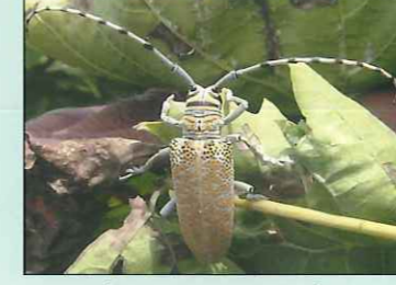
अंकुर फस्त करणारा प्रौढ