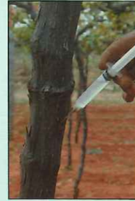
औषधाचे इंजेक्शन देताना