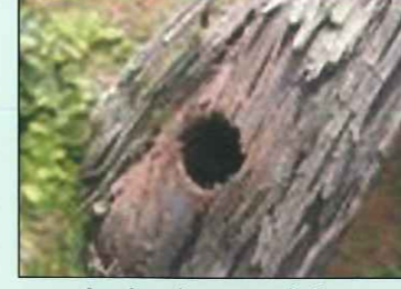
प्रौढाचे बाहेर पडण्याचे छिद्र

प्रौढ भूंगेरा मुख्य खोडास किंवा वलांड्यास आतून गोल छिद्र करून बाहेर येतो. भूंगेरा नवीन वाढणारा शेंड्यावरती वरखडून त्याचे नुकसान करतो तसेच सालीमध्ये अंडी घालण्यासाठी सालीस भेगा/चिरा पाडतो. खोडकिड्याची अळी मुख्य खोड आणि वलांड्यात आतील भागात अन्न खाण्यासाठी आतमध्ये वरच्या बाजूस व खालच्या बाजूस पोखरते व अशाप्रकारे नुकसान करते. मुख्य खोड आणि वलांडे यांना पडलेल्या/असलेल्या छिद्रातून भूसा बाहेर दिसणे ही