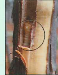
लहान अळ्या पोखरताना

खोडकिड्याच्या नुकसानीचे सर्वसाधारणपणे दिसणारे लक्षण आहे. तसेच छिद्रातून डिक आल्यासारखे दिसणे हे देखिल नुकसानीचे लक्षण आहे. खोडावरती असलेल्या छिद्रावरती त्यातून बाहेर आलेले चिकटभाग वाळल्यानंतर घट्ट चिटकून बसतो. करवतीने लाकडाचा भूसा ज्याप्रमाणे पडतो