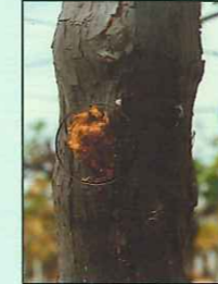
छिद्रावरती भूसा दिसत आहे