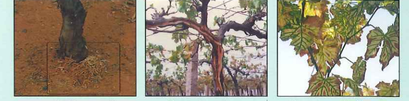
भूसा जमिनीवर पडलेला

त्याप्रमाणे ज्या छिद्रामध्ये खोडकिडा आहे त्यातून मोठ्या प्रमाणात भूसा पडलेला दिसतो. ज्या झाडामध्ये खोडकिडा आहे त्या झाडाची पाने पिवळी पडतात आणि पाने गळण्यास सुरवात झालेली दिसते. नंतर झाड वाळते आणि फांद्या सुद्धा मरतात. ज्यावेळीवर खोडकिड्याचा प्रार्दुभाव झालेला आहे ती