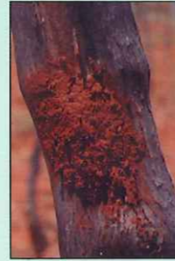
चिखलाने छिद्र बंद केलेले आहे

अ. इंजेक्शन देण्यासाठी पेट्रोल, कार्बनडायसल्फाईड किंवा मिथाईल ब्रोमाईड, क्लोरोफॉर्म किंवा डायक्लोरोव्हॉस यांचा ५ मि.ली. प्रति छिद्र या प्रमाणात टाकले असता ते खोडकिडींच्या आळ्यांचा नाश करण्यासाठी अधिक प्रभावी असल्याचे आढळून आले आहे. डायक्लोरोव्हॉस ७५ एस.सी. ८० मि.ली. प्रति लिटर याप्रमाणात द्रावण करून त्याचे इंजेक्शन दिल्यास किंवा प्लास्टीकच्या बाटलीच्या सहाय्याने (वॉश बॉटल) छिद्रे भरेपर्यंत द्रावण त्यामध्ये टाकले असता खोडकिड्यांच्या आळ्यांना मारून टाकते.