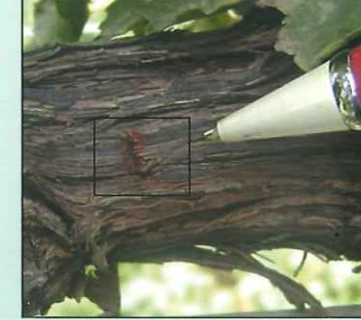
सालीवर पडलेल्या चिरा

खोडकिड्याच्या नुकसानीचे सर्वसाधारणपणे दिसणारे लक्षण आहे. तसेच छिद्रातून डिक आल्यासारखे दिसणे हे देखिल नुकसानीचे लक्षण आहे. खोडावरती असलेल्या छिद्रावरती त्यातून बाहेर आलेले चिकटभाग वाळल्यानंतर घट्ट चिटकून बसतो. करवतीने लाकडाचा भूसा ज्याप्रमाणे पडतो