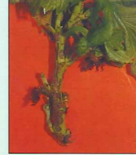
फांद्यावर पडलेले डाग